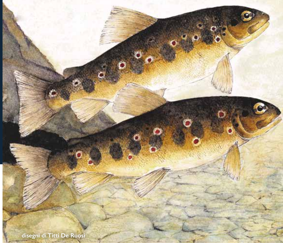
disegni di Titti De Ruosi